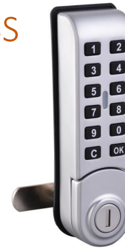
Item No. : MK 728 Cerradura Electrónica. Sistema Multiusuario

Material: Carcasa de Zinc y cromo zatinado. Fijación con Tornillos y seguro a través de paleta. Color: Gris y Negro