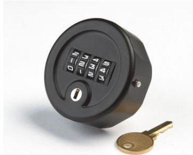
Item No.: MK708 Cerradura de rulinas de 4 dígitos Tipo Perilla, Sistema Multiusuario Amaestrada

Materia: Aleación de zinc, plástico ABS y latón Terminado: Recubrimiento en polvo Combinaciones de llave: 10,000 Color: Negro y Blanco