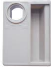
Item No. : MK T-20 Jaladera Material: Pástico ABS Color: Gris Peso : 40Grms/ Pza