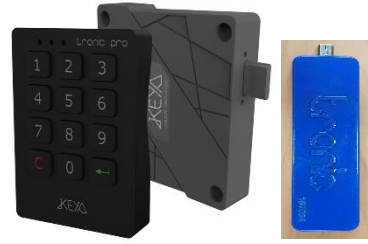
Item No. : T.PRO TRONIC PRO Cerradura Electrónica. Sistema Multiusuario Y Abonado Material: Plástico ABS Color: Negro