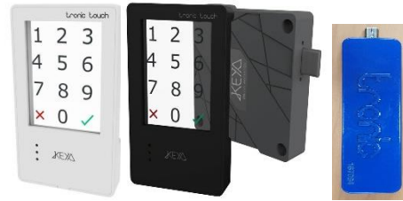
Item No. : T.TOUCH TRONIC TOUCH Cerradura Electrónica. Sistema Multiusuario Y Abonado Material: Plástico ABS Color: Negro / Blanco