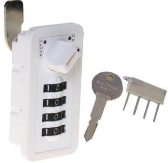
Item No. : MK 707 Cerradura de rulinas de 4 dígitos Sistema Multiusuario Amaestrada.

Material: Aleación de zinc, latón y plástico ABS Terminado: Recubrimiento en polvo Combinaciones de llave: 10,000 Color: Blanco