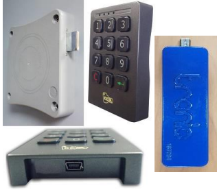
Item No. : T+ TRONIC PLUS Cerradura Electrónica. Sistema Multiusuario y Abnado Material: Plástico ABS Color: Negro